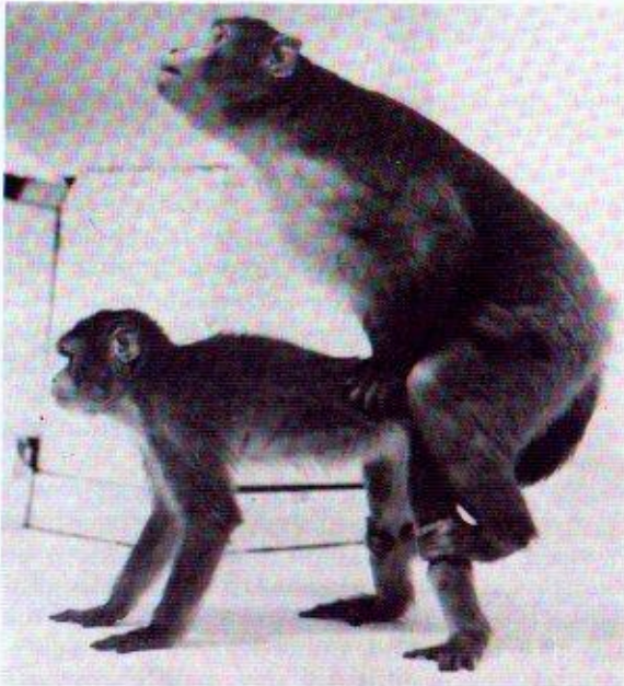
Figure 12.5 Basic adult copulatory posture in monkeys.